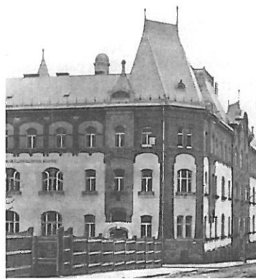
A korabeli képeslap szerint a Petrezselyem utcai oldalt a „M. KIR. ÁLLAMI ROVARTANI ÁLLOMÁS” foglalta el.

„Az a régi óhaj, hogy az Intézet Budapesten is saját hajlékot nyerjen, egy lépéssel közelebb jutott a megvalósuláshoz, amennyiben a földművelésügyi m. kir. miniszter úr ő nagyméltósága a Kisrókus-utca és az Intézet-utca sarkán levő telket, mely a kincstár tulajdona, jelölte ki a felállítandó épület helyéül. Egyúttal elrendelte, hogy ugyanabban az épületben a m. kir. rovartani állomás is nyerjen elhelyezést, mert célszerűnek mutatkozott e két rendbeli intézet épületei számára előirányzott összeget egyesíteni és mindkét intézetet közös épületben bár, de egymástól teljesen különváltan elhelyezni.” „A miniszter úr Önagyméltósága ... értesítette az Intézetet, hogy bár az új épület mellett még fennmaradt kincstári telket más állami hivatal részére kí-